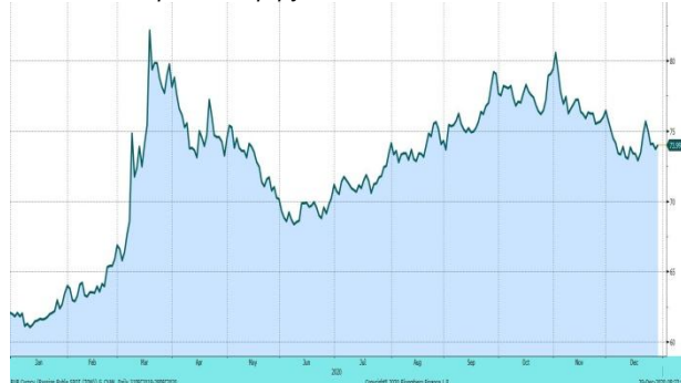
Валютная пара доллар-рубли