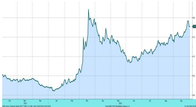
Валютная пара доллар-рубли