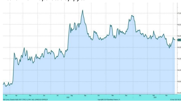
Валютная пара доллар-рубли