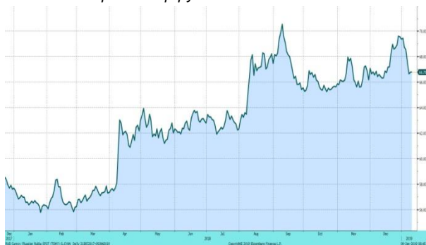
Валютная пара доллар-рубли