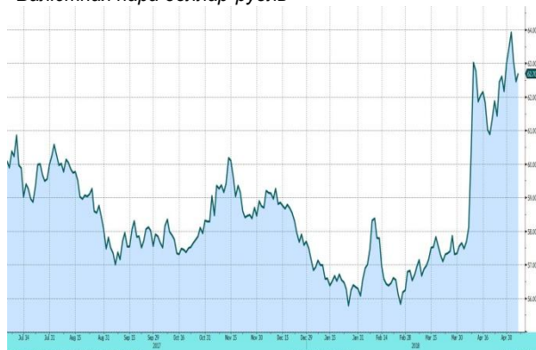
Валютная пара доллар-рубли