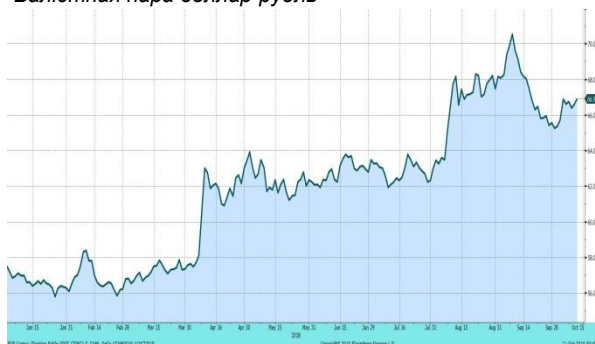
Валютная пара доллар-рубли