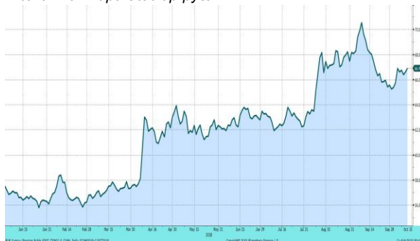
Валютная пара доллар-рубли