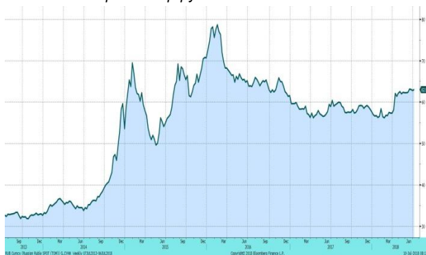
Валютная пара доллар-рубль