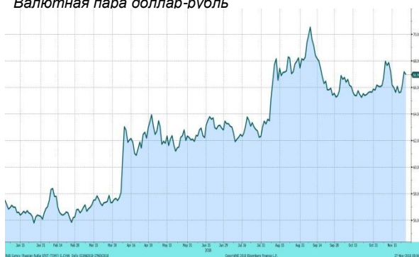
Валютная пара доллар-рубль